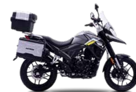
Auch als X-NORD 125 Touring erhältlich